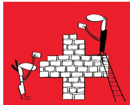
© CFM - Programme « Citoyenneté »

Les projets qui ont pour but de permettre à la plus grande partie possible de la population de participer ou d'être impliquée dans la vie publique sur une base durable. Les personnes impliquées dans le projet doivent avoir la possibilité de participer au déroulement du projet. En outre, le projet doit promouvoir tout ou partie des aspects de la participation politique (information, échange, co-création, co-décision). Les résultats doivent être consignés dans un rapport final.